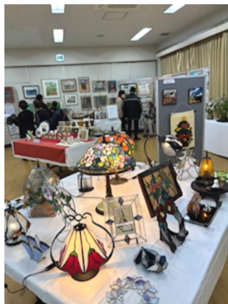
牛頸区芸能発表会