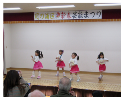
新春の浦区芸能まつり