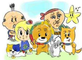
NPO 法人共働のまち大野城 PRキャラクター