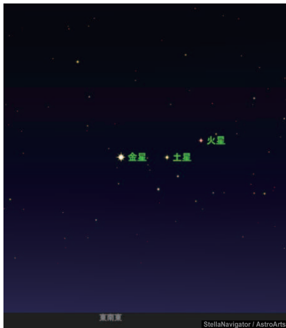
2022年4月1日午前5時の東空

暖かい日差しが降り注ぐ春になりました。この時期は夜の星空観測にも出かけやすくなってきます。もちろん夜に輝く冬～春の星座たちも魅力的ですが、今年の4月は夜ではなく朝（日の出前）がオススメです。なぜなら惑星たちが日の出前の空にならんでいるからです！残念ながら水星と天王星は反対側なので観測できませんが、「火星・土星・金星」が接近して輝き、動きも早いので毎日場所が変わり面白い眺めになります。4月の後半になるとここに月もやってきてより賑やかになっていきます。オススメ時間は午前4時～5時ごろ。早起きして惑星たちを観測してみよう。