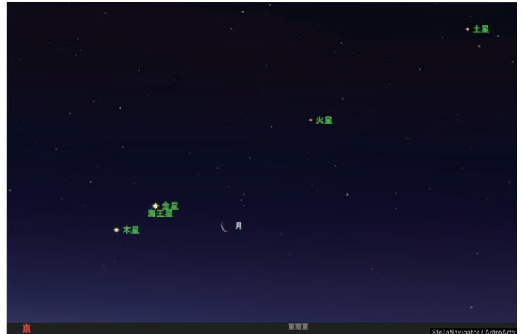
2022年4月27日午前4時30分の東空