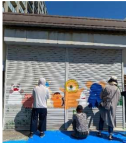
シャッターアートの様子

※コミュニティセンターの受付窓口は12月27日(火)まで、電子メールでの申し込みは12月31日(土)まで ✉ minami-ps@onj.csf.ne.jp