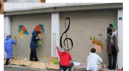
筒井・錦町まちづくり研究会の活動の様子