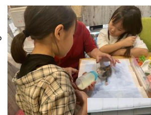
ONOJOにやっとなわくの活動の様子