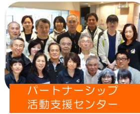
パートナーシップ 活動支援センター