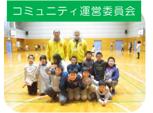
コミュニティ運営委員会