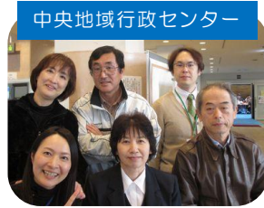
中央地域行政センター