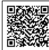
「すまっぼん」 QRコード(注1)

中央コミュニティセンターホームページ … http://onojo-com.info/chuou/ (ホームページではこのコミュニティ通信をカラーでご覧いただけます)