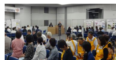
「ファンド事業実施報告会開催風景」