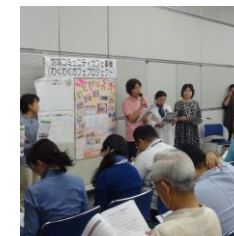
「地域交流カフェ事業」