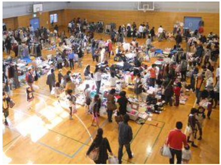
フリーマーケット (昨年の模様)