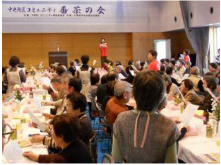
番茶の会 (昨年の模様)

発行：中央コミュニティセンター (地域行政センター) 大野城市中央1-5-1 TEL：573-3151 FAX：573-3154